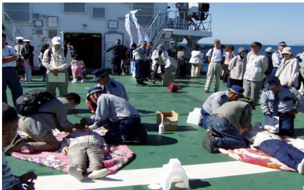
救助員による心肺蘇生法の講習

（当会は、平成14年4月1日「特定非営利活動促進法」に基づく、特定非営利活動法人として長崎県知事から設立認証を得ました。）