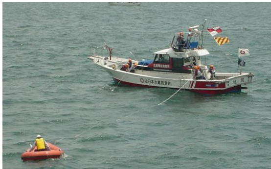
救助訓練中の長崎県水難救済会 救助船「旭龍」

沿岸海域で発せする船舶海難や海浜事故等の水難事故の救助活動を行うボランティア団体で、その母体は「日本水難救済会」として明治22年に設立されました。長崎県水難救済会は、県下全域に116ヶ所の救難所・支所を設置し、4,973名（H25年4月現在）の救難所員により救助活動を行っています。